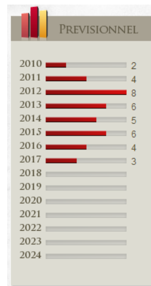
Exemple de Prévisionnel